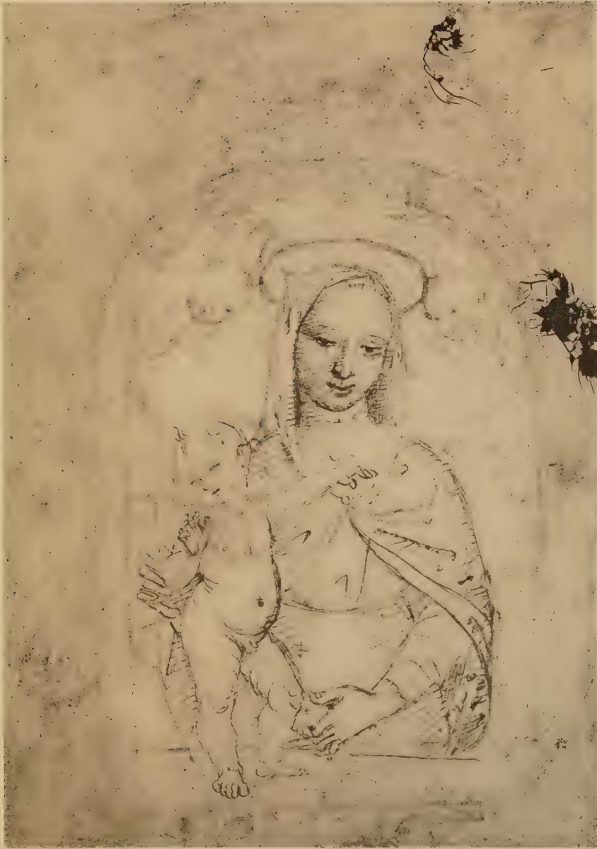
La Vierge et l'Enfant